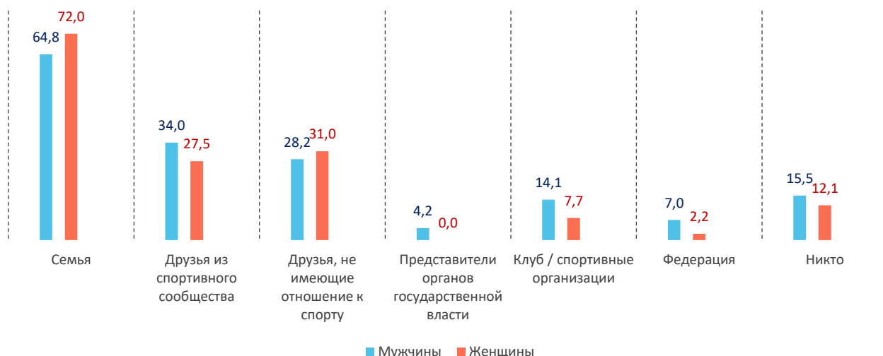
Рис. 2. Субъекты помощи спортсменам на этапе завершения спортивной карьеры (n = 188 чел.), %

настроение спортсменов, не снижает своей актуальности. Однако следует заметить, что мужчинам-спортсменам чаще, чем женщинам, оказывают помощь институциональные образования спортивной направленности. Причем чем продолжительнее стаж интеграции в поле спорта, чем выше уровень квалификации спортсменов, тем чаще организации/учреждения участвуют в их жизни на этапе завершения спортивной карьеры.