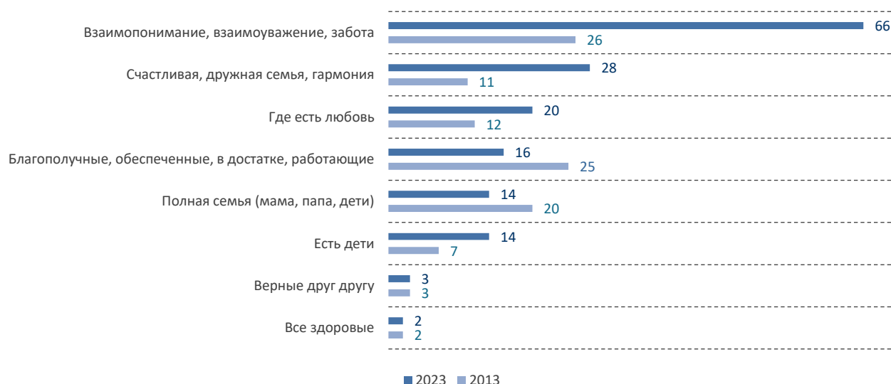
Рис. 3. Как россияне представляют себе «идеальную семью» (первые 8 вариантов ответа), % Составлено по: Идеальная семья – 2023 (обзор 6 июля 2023 года) // ВЦИОМ. URL: https://wciom.ru/analytical-reviews/analiticheskii-obzor/idealnaja-semja-2023 (дата обращения 02.04.2024).