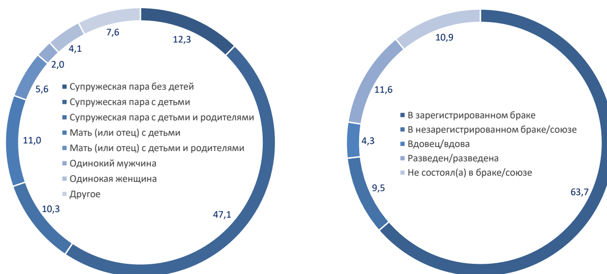
Рис. 1. Демографический тип семьи и семейное положение респондентов, % Составлено по: данные БД «Таганрог-2014» (Локосов и др., 2022).

оценок при выстраивании балльных шкал подбора критериев при множестве альтернатив), где 1 – худшая оценка, а 5 – лучшая (Крошилин и др., 2023). Это позволило получить сопоставимые величины, которые в БД характеризовали количественные и качественные показатели.