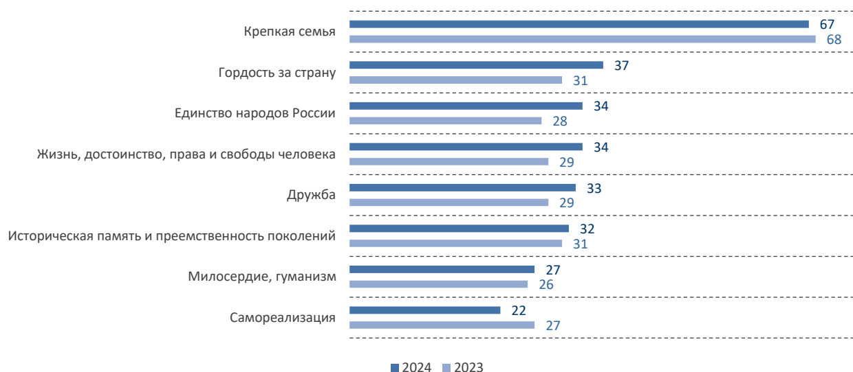
Рис. 2. Наиболее важные ценности для россиян (первые 8 вариантов ответа), %

Составлено по: Семья как ценность (обзор 24 января 2024 г.) // ВЦИОМ.