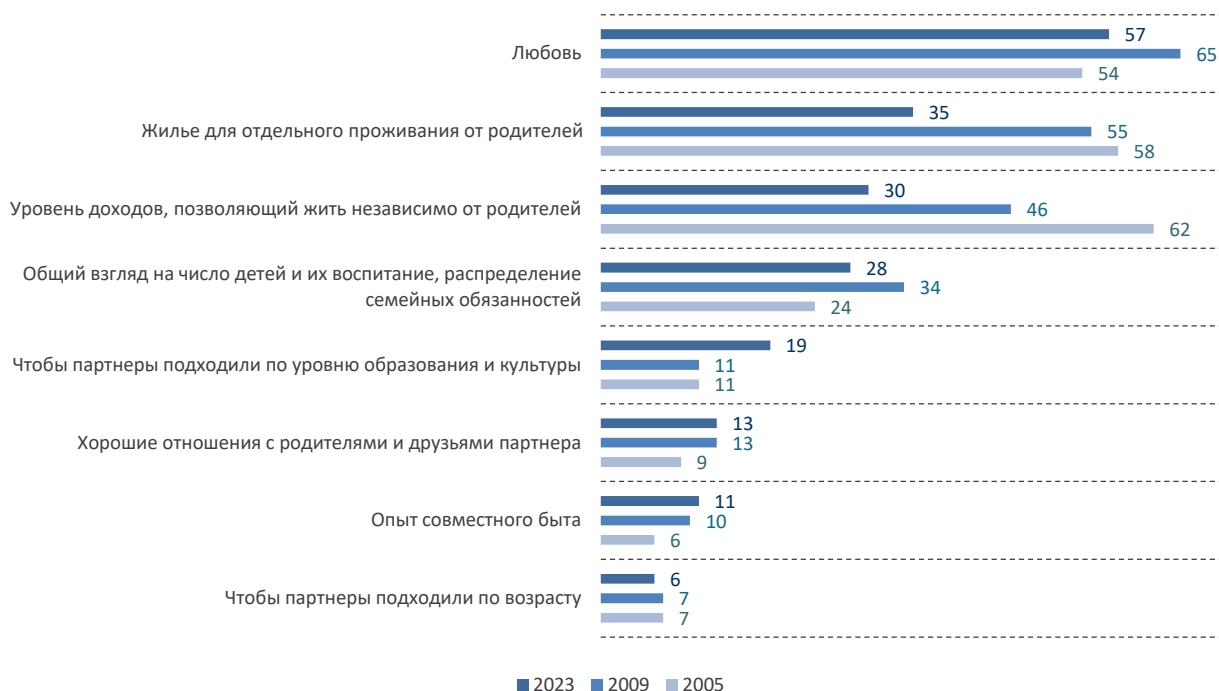
Рис. 4. Что, по мнению россиян, является необходимым для создания семьи (первые 8 вариантов ответа), % Составлено по: Идеальная семья – 2023 (обзор 6 июля 2023 года) // ВЦИОМ. URL: https://wciom.ru/analytical-reviews/analiticheskii-obzor/idealnaja-semja-2023 (дата обращения 02.04.2024).

пятый россиянин. В 2013 году четверть опрошенных одним из самых главных факторов для себя определяли «достаток, благополучие и обеспеченность»; выбор данной позиции спустя 10 лет уменьшился на 9%.