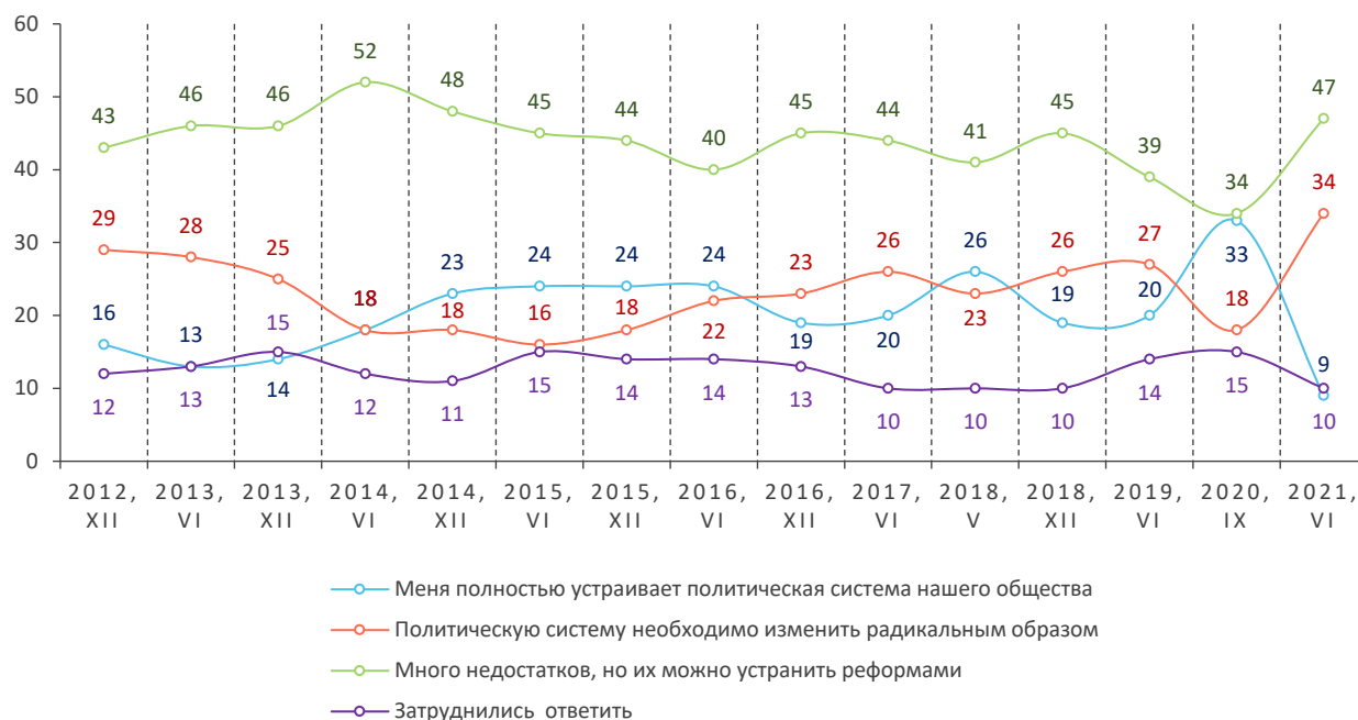
Рис. 1. Отношение к политической системе общества, % от числа опрошенных