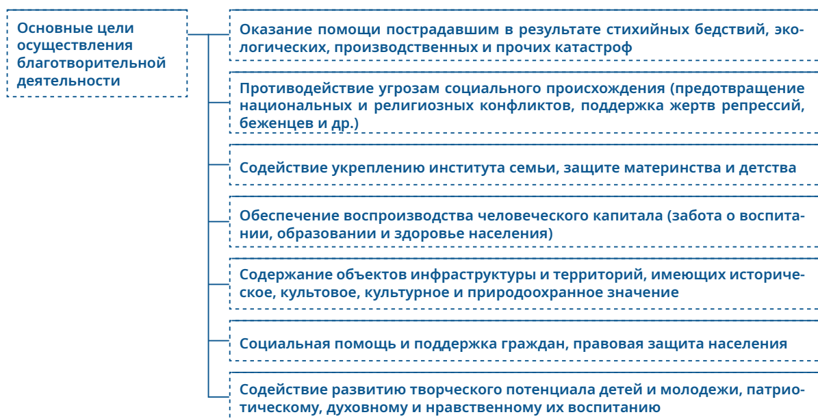
Рис. 1. Основные цели осуществления благотворительной деятельности

Составлено автором по: Савина Т.Н. Благотворительность как стадия социального позиционирования бизнеса (возможности, проблемы, перспективы) // Проблемы. Поиск. Решения. 2014. № 27 (264). С. 58–66.